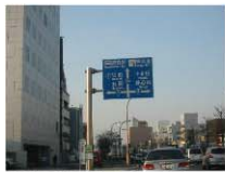
橋を過ぎると中心地に近づいてまいります。左手に見える日本生命さんのビルのある交差点(柳町交差点)を左へ曲がり国道4号線に入ります。交差点の手前の看板には「弘前・浪岡」⑦と書いていて左折して数分で青森県庁がございますが、そこを境に4号線と7号線に分かれております。東の八戸・岩手方面は4号線、西の弘前・秋田方面は7号線となります。