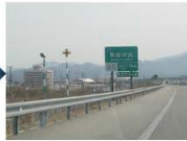
左手に青森市街地が見えてまいります。まもなく青森中央IC出口です。