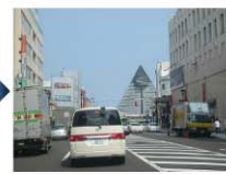
右手に見えるホテル前の交差点を右に曲がります。建物の横が駐車場の入り口となります。高さ1.5m・長さ5.0m・幅1.95mまでの立体駐車場となります。7:00~23:00までは係員がおりますので指示に従ってご入庫願います(14:00~翌11:00まで1泊700円)。尚、ワンボックス等の大きめのお車に關しましては周辺の駐車場へのご案内となります。三角の建物「観光物産館アスパム」さんと提携しておりますので1泊500円にてご利用できます(駐車券を販売しておりますのでフロントまでお越しくださいませ)。