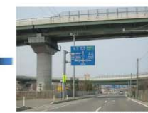
200~300m先に交差点がございます。右に曲がりますので右側斜線をお進み下さい。