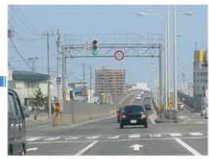
1kmほど進んで中央大橋という橋を渡ります。通行料は無料です。橋の下はJRさんの操車場がございます。