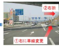
右折斜線に入り県庁・市役所方面の120号線をお進み下さい。