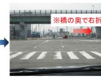
料金所からすぐの信号の交差点を真っ直ぐ進みながら右に曲がり。 ※橋の奥で右折