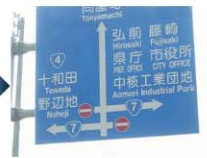
料金所を通過するとすぐに環状7号線が通っています(走ってきた高速道路の下)。信号を過ぎて右へ曲がってください。弘前・三内丸山遺跡・県庁・市役所方面へ向かいます。