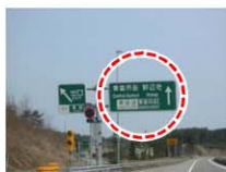
東北自動車道青森方面へ進むと「青森IC」と「青森中央IC」の分岐点がございますので右斜線に入って進んでください。