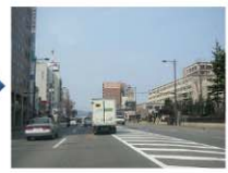
県庁を超えた交差点のコカコーラさんの看板が目印です。右折してください。