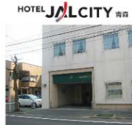
到着です。お疲れ様でした。ごゆっくりお過ごしくださいませ。

〒030-0803 青森県青森市安方2丁目4番12号 TEL. 017-732-2580 FAX. 017-735-2584