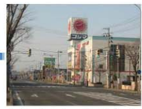
右折しましたらしばらくは真っ直ぐお進み下さい。右手には電気のコジマさんが見えてまいります。