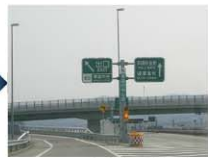
左手に出口がございます。真っ直ぐ進んでまいりますと青森東IC(終点)まで行ってしまいますのでご注意ください。